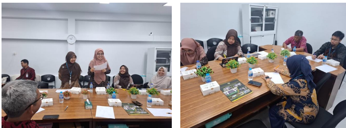
Gambar 2. Kegiatan Pelatihan, Workshop, dan Diskusi

Suasana kegiatan berlangsung dinamis dan menyenangkan, di mana guru berperan sebagai fasilitator yang mengarahkan, sementara siswa menunjukkan keterlibatan penuh, rasa ingin tahu, dan semangat kebersamaan. Dokumentasi memperlihatkan interaksi positif antara guru dan siswa yang mencerminkan nilai gotong royong, disiplin, serta kepedulian. Keaktifan guru dalam mengikuti kegiatan dapat terlihat pada Gambar 2.