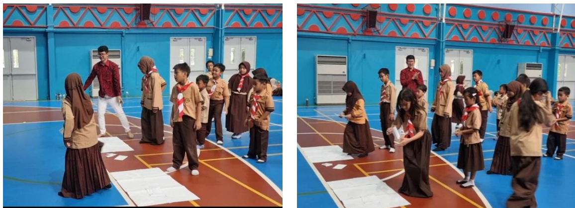
Gambar 3. Kegiatan Praktik Pembelajaran

Berdasarkan Gambar 3, siswa tampak sangat aktif dan antusias mengikuti permainan “Laga Hak & Kewajiban: Indonesia vs Thailand”. Melalui permainan ini, mereka diajak untuk mengenal, membedakan, serta memahami hak dan kewajiban warga negara dalam konteks kehidupan sehari-hari. Dengan metode kompetisi kelompok, siswa berlomba-lomba menjawab pertanyaan yang diberikan guru terkait peran warga negara di kedua negara tersebut. Suasana menjadi semarak karena setiap kelompok berusaha tampil maksimal untuk mendapatkan poin kemenangan.