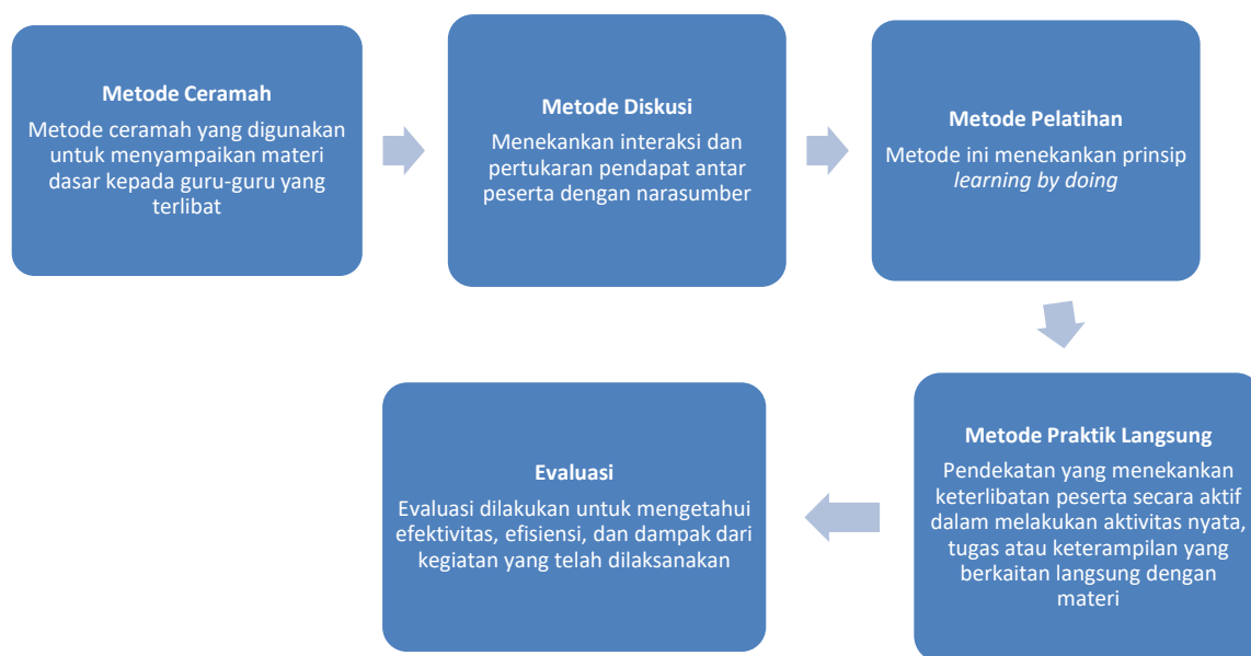
Gambar 1. Alur Metode Pelaksanaan Program

Dalam program yang dilaksanakan, khalayak sasaran meliputi guru dan siswa sekolah dasar di Sekolah Indonesia Bangkok dengan jumlah keseluruhan sebanyak 31 peserta. Adapun pelaksanaan program dilakukan pada tanggal 20 – 24 Agustus 2025 di Sekolah Indonesia Bangkok, Thailand. Dalam mengukur ketercapaian program maka terdapat indikator keberhasilan kegiatan yaitu menggunakan kuesioner yang diberikan untuk guru dan siswa. Adapun secara rinci pada Tabel 1 dan 2.