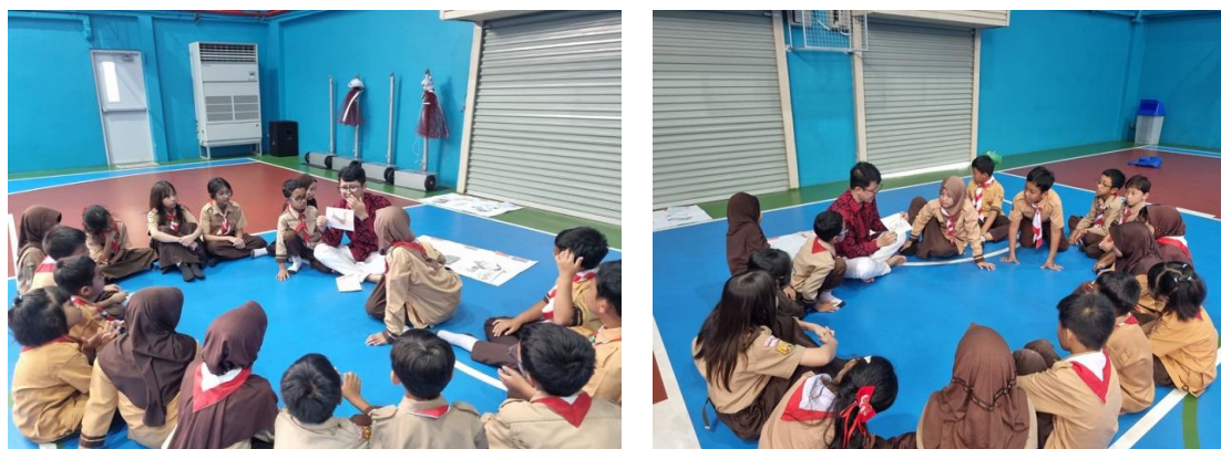
Gambar 4. Kegiatan Permainan bersama Siswa

motivasi dan keterlibatan siswa dibandingkan metode ceramah semata. Setelah melaksanakan permainan, pengabdian melakukan penguatan dan refleksi Bersama siswa mengenai permainan yang sudah dilaksanakan dikaitkan dengan materi literasi kewarganegaraan. Potret dokumentasi kegiatan refleksi dan penguatan dapat dilihat pada Gambar 4.