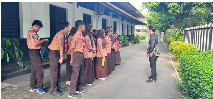
Gambar 4. Kedatangan dan Briefing Sebelum Pelaksanaan Kegiatan

Pelaksanaan kegiatan Learning by Visiting dimulai dengan mempersiapkan keperluan yang dibutuhkan selama proses pembelajaran. Setelah perizinan selesai diperoleh, penjadwalan keberangkatan ke lokasi di bekas kantor Landbouw Maatschappij Oud Djember (PT. Perkebunan Nusantara I Regional 5), dan bahan ajar telah diselesaikan, maka tahap penerapanpun dapat dimulai. Kegiatan dilaksanakan pada tanggal 13 Juni 2025 pukul 07.00. Titik kumpul keberangkatan rombongan berada di SMA Negeri 4 Jember yang beralamat di Jl. Hayam Wuruk No.145, Krajan, Sempusari, Kecamatan Kaliwates, Kabupaten Jember. Rombongan terdiri dari 5 Kendaraan, dengan jumlah peserta yaitu 20 peserta didik kelas XI IPS Peminatan Sejarah, 2 Pendidik Sejarah SMA Negeri 4 Jember, 2 Mahasiswa Pendidikan Sejarah Angkatan 2022, 3 Dosen Pendamping yang berasal dari Research Group 1 Pendidikan Sejarah ( History Education ).