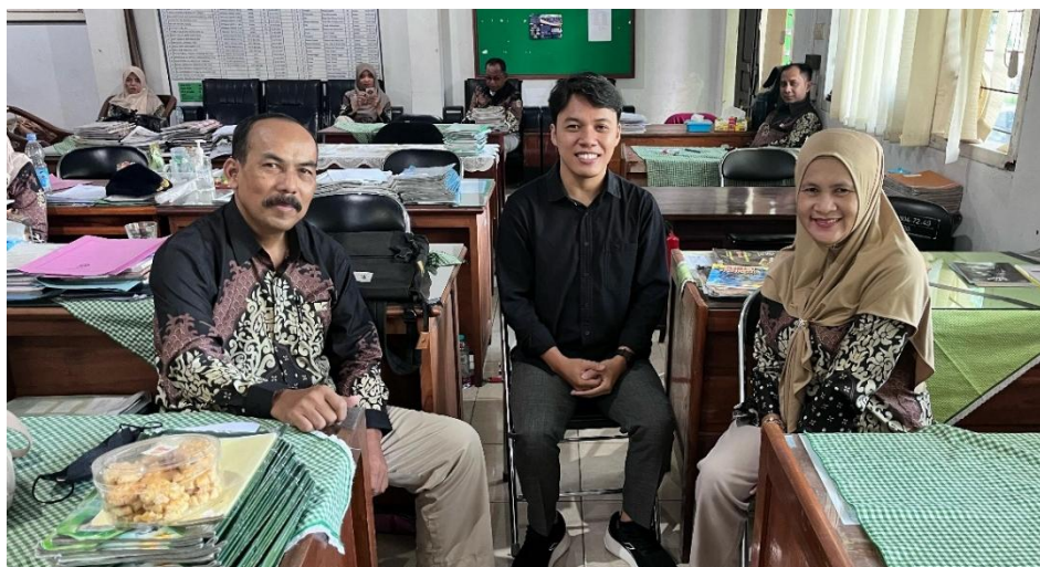
Gambar 1. Wawancara dengan Pendidik Mata Pelajaran Sejarah SMA Negeri 4 Jember

Salah satunya adalah SMA Negeri 4 Jember yang merupakan salah satu sekolah menengah atas negeri favorit di Kabupaten Jember. Berdasarkan hasil wawancara dengan pendidik mata pelajaran sejarah, kondisi kesadaran sejarah menjadi isu yang sering ditemukan. Data ini didukung oleh penelitian terdahulu pada tahun 2022 yang menyatakan bahwa tingkat kesadaran sejarah peserta didik sebesar 59,42% (Umami et al., 2022). Oleh karena itu, disarankan dilakukan upaya meningkatkan kesadaran sejarah ( Historical Consciousness ) peserta didik SMA Negeri 4 Jember dengan pembelajaran yang lebih inovatif dan kreatif.