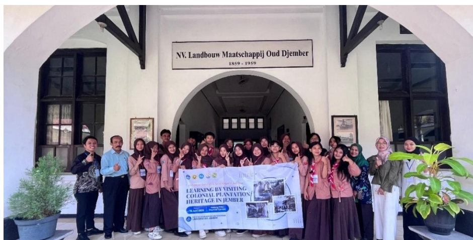
Gambar 9. Dokumentasi Akhir Kegiatan Pembelajaran