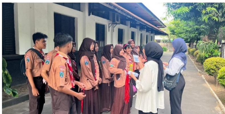
Gambar 5. Pembagian ID Card dan Pemaparan Aturan Pembelajaran