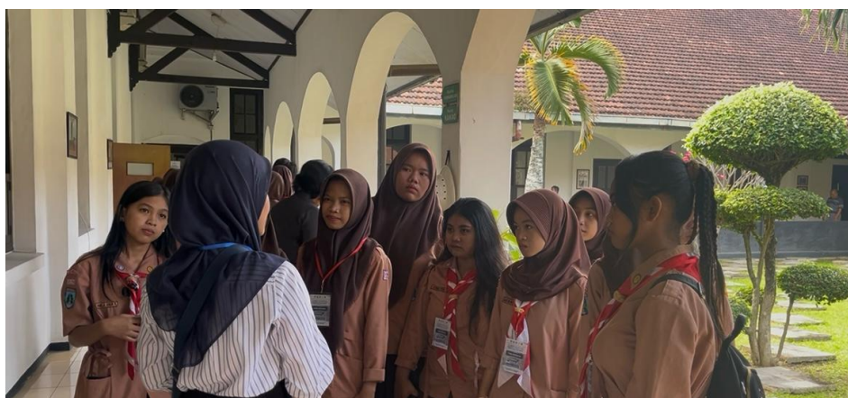
Gambar 6. Kelompok 1 Sedang Mendengarkan Pemaparan dari Edukator

Peserta didik selama mengikuti kegiatan pembelajaran dibagi ke dalam dua kelompok yang beranggotakan masing-masing 10 orang dengan 1 mahasiswa sebagai edukator (lihat Gambar 6 dan 7). Masing-masing kelompok akan mengikuti edukator sesuai dengan rute perjalanan yang sudah ditentukan sebelumnya. Rute dimulai dari menyusuri lobi utama gedung yang memamerkan koleksi foto, peta, dan benda-benda lain peninggalan kantor. Kemudian kelompok pertama menyusuri bagian kanan gedung sedangkan kelompok kedua menyusuri bagian kiri gedung. Keduanya akan diarahkan dengan pertemuan titik akhir di ruang aula utama gedung yang terletak di bagian belakang.