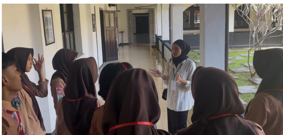
Gambar 7. Kelompok 2 Sedang Mendengarkan Pemaparan dari Edukator

Materi yang disampaikan oleh masing-masing edukator dimulai dari awal mula keluarga George Birnie membuka lahan perkebunan Tembakau di wilayah Jember. Edukator juga menyampaikan sumber-sumber yang digunakan untuk menjelaskan fakta-fakta sejarah tentang bagaimana keluarga