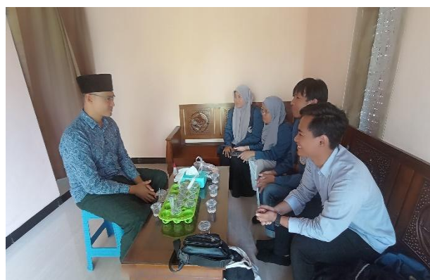
Gambar 1. Wawancara Sekretaris Desa

Pengelolaan arsip keluarga pada masyarakat Desa Kamulan masih dilakukan secara manual dan belum terorganisir dengan baik. Hal tersebut mengakibatkan adanya potensi arsip yang hilang/ lupa menyimpan atau bahkan terdapat kerusakan baik akibat suhu, tempat penyimpanan maupun cara penyimpanan yang dilakukan.