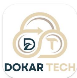
Gambar 3. Logo Aplikasi Dokar-Tech

Dokar-Tech merupakan software atau aplikasi yang memberikan layanan penyimpanan arsip berharga yang dimiliki. Aplikasi ini merupakan sebuah alternatif untuk mengatasi berbagai masalah kearsipan seperti kasus tentang kehilangan atau kerusakan arsip pribadi, keluarga, maupun organisasi yang dikarenakan kurang baiknya penyimpanan dan pengelolaan arsip. Dokar Tech menawarkan layanan penyimpanan cloud yang mulus dan aman untuk melindungi data berharga dengan aman.