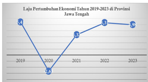
Gambar 1. Laju Pertumbuhan Ekonomi Tahun 2019-2023 di Provinsi Jawa Tengah (Sumber: Badan Pusat Statistik Jawa Tengah 2019-2023 diolah)