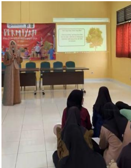
Gambar 1. Penyampaian materi Adab