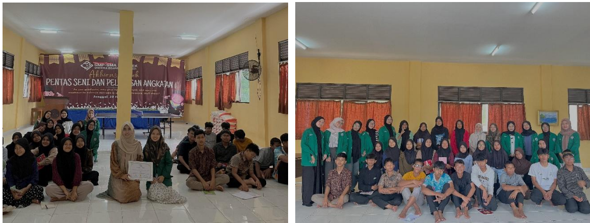
Gambar 2. Diskusi dan Refleksi Peserta Didik dalam Kegiatan Edukasi Adab