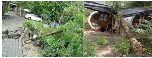
Gambar 3. Pohon Kersem tumbang menimpa bangunan sekitarnya.

yang ditanam di area YPP Nufo adalah pohon kersem ( Muntingia calabura L.) yang akarnya kurang kuat dan pohonnya tidak mampu bertahan lama (Gambar 3)