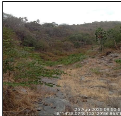
Gambar 3. Longsor di tahun 2021