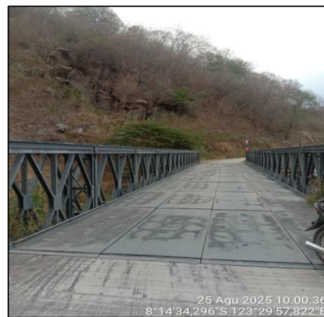
Gambar 4. Longsor di Kemiringan Lereng