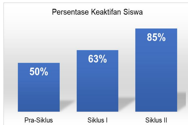
Diagram 3. Persentase Keaktifan pada Pra Siklus, Siklus I, dan Siklus II

Terakhir, persentase peningkatan keaktifan siswa dalam proses pembelajaran pada penelitian ini dapat dilihat pada diagram berikut ini.