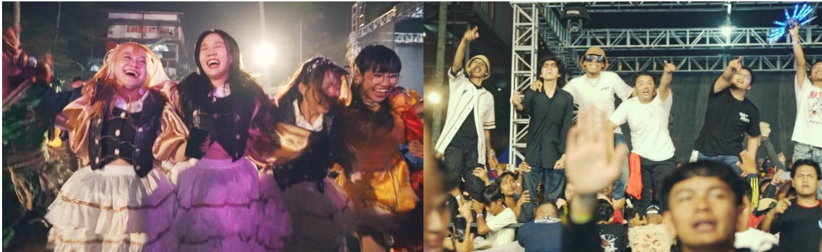
Gambar 1. Suasana euforia penonton dan penampil

Penggunaan medium shot dan wide shot memperlihatkan bagaimana audiens tidak diposisikan sebagai penonton pasif, melainkan menjadi bagian dari atmosfer pertunjukan. Kamera menangkap interaksi antara performer dan penonton secara bersamaan dalam satu frame sehingga menciptakan kesan ruang yang intim dan kolektif. Kedekatan fisik antara performer dan audiens menjadi karakter penting dalam kultur idol underground yang direpresentasikan dalam dokumenter.