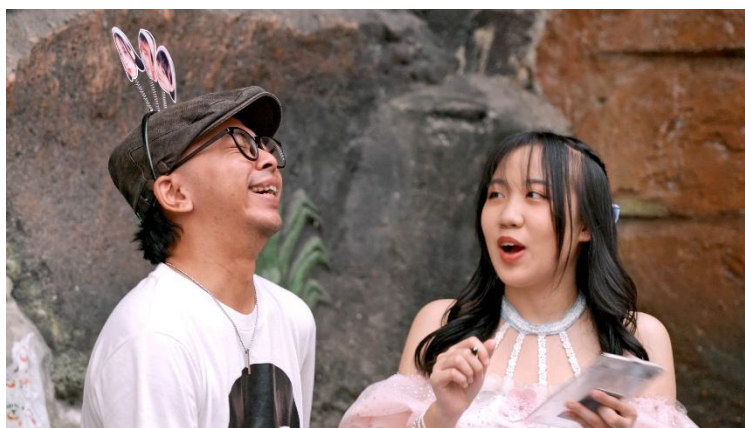
Gambar 6. Dokumentasi interaksi komunitas Kohisekai di luar pertunjukan

Film dokumenter Zhenryoku merepresentasikan Kohisekai sebagai subkultur alternatif yang berkembang di luar kultur idol mainstream. Representasi tersebut terlihat melalui visualisasi komunitas yang dibangun secara kolektif dan independen. Dokumenter tidak menampilkan Kohisekai sebagai idol dengan sistem industri besar, melainkan sebagai komunitas yang tumbuh melalui kedekatan sosial antara performer dan fandom.