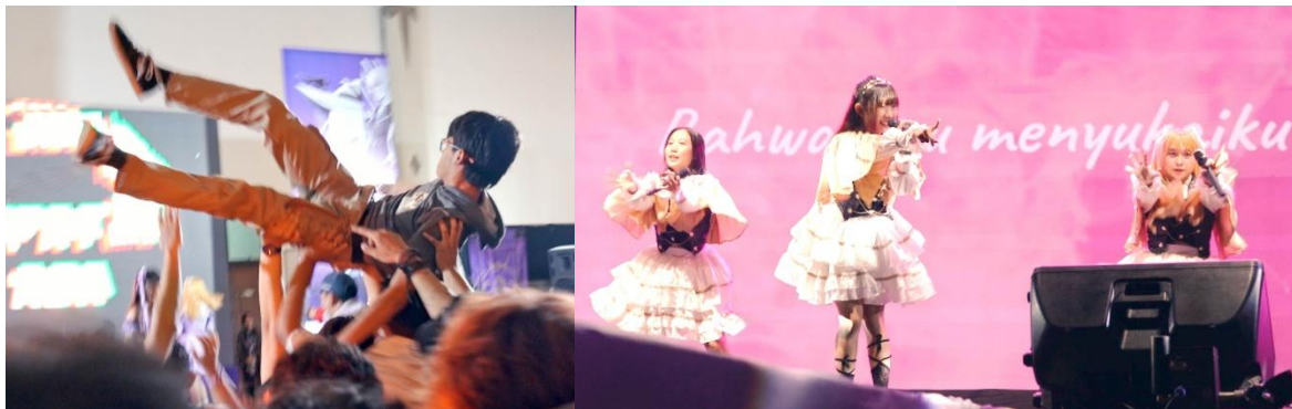
Gambar 4. Penggunaan handheld shot dalam merekam dinamika pertunjukan

Pendekatan visual dalam Zhenryoku menggunakan teknik handheld camera yang menghasilkan kesan spontan dan dinamis. Teknik ini membuat dokumenter terasa dekat dengan aktivitas komunitas dan menciptakan pengalaman visual yang lebih personal. Kamera bergerak mengikuti aktivitas performer maupun penonton secara langsung tanpa banyak penggunaan pergerakan kamera yang stabil dan formal, sehingga visual dokumenter terasa lebih organik dan natural.