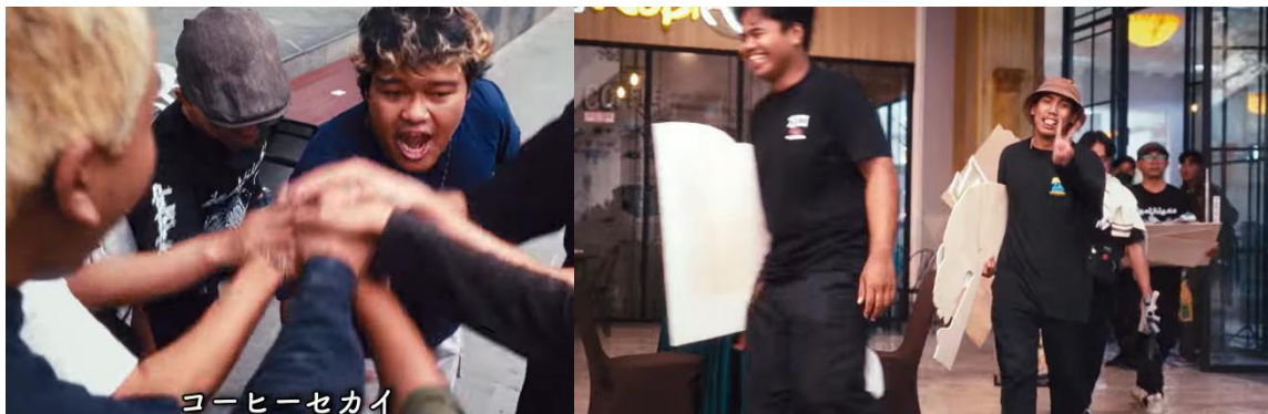
Gambar 3. Fans mempersiapkan kebutuhan acara ulang tahun Kohisekai

Representasi tersebut menunjukkan bahwa fandom dalam kultur idol underground memiliki karakter partisipatoris dan kolektif. Menurut Stuart Hall (1997), representasi visual tidak hanya merekam realitas, tetapi juga membentuk makna tertentu terhadap suatu kelompok sosial. Dalam dokumenter Zhenryoku , relasi antara idol dan fandom direpresentasikan sebagai hubungan yang intim dan berbasis solidaritas komunitas.