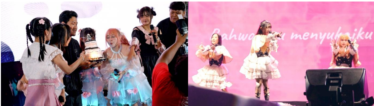
Gambar 2. Interaksi Kohisekai dengan penonton saat pertunjukan berlangsung

Film dokumenter Zhenryoku memperlihatkan bahwa fandom dalam komunitas Kohisekai tidak hanya menjadi konsumen hiburan, tetapi juga bagian penting dari keberlangsungan komunitas.