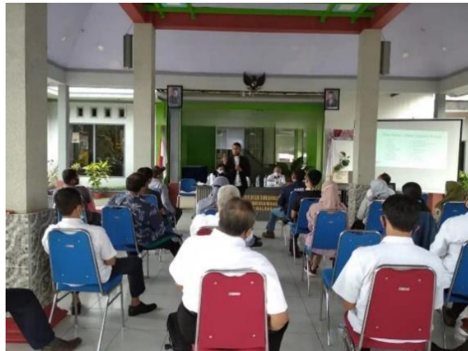
Gambar 4. Sosialisasi Website Desa Sukonolo