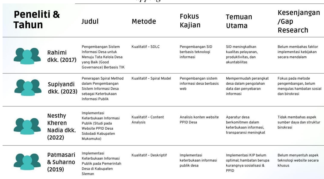
Gambar 1. Mapping Riset Terdahulu