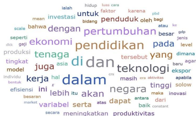
Gambar 3. Hasil Word Clouds Faktor Yang Mempengaruhi Pertumbuhan Ekonomi Nasional

Gambar di atas menunjukkan hasil olah data menggunakan ATLAS Ti berupa Word Clouds yang menunjukkan faktor-faktor pendorong ekonomi digital di Indonesia. Dalam